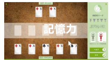
ワーキングメモリー